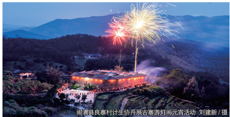
闽清县良寨村计生协开展古寨游灯闹元宵活动