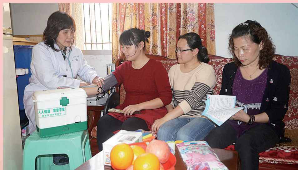
图片新闻：晋安象园街道计生协组织社区卫生服务中心妇科医生开展孕检服务，宣传「全面两孩」政策