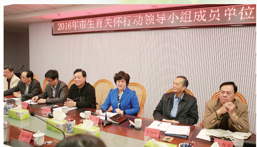
2016年市生育关怀行动领导小组成员单位

陈晔副市长作了重要讲话，她指出2015年我市各级各部门围绕计生群众实际需求，积极开展生育关怀行动，有效帮扶了计生家庭，推动了全市人口与计生工作转型发展，取得了良好成效。她对2016年我市生育关怀行动强调了三点意见（另行刊发）。